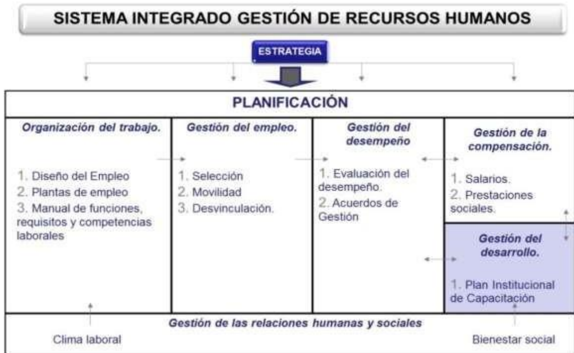
Figura N° 2. Subsistemas de la Gestión del Recursos Humanos. Adaptado de Serlavós, R. tomado de: (Longo, 2002 pág. 15)

Dando cumplimiento con la planeación estratégica del Talento Humano, uno de los componentes centrales es la Gestión del Recurso Humano, el cual se desarrolla a través de los siguientes subsistemas: