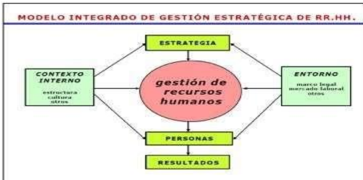
Figura N° 1. Modelo Integrado de Gestión Estratégica del Recurso Humano adaptado de Serlavós, tomado de: (Longo, 2002 pág. 11)

Es un sistema integrado de gestión, cuya finalidad básica o razón de ser es la adecuación de las personas a la estrategia institucional (Longo, 2002. pág. 13.). El éxito de la Planeación Estratégica del Recurso Humano, se da en la medida en que se articula con el Direccionamiento Estratégico de la Entidad (misión, visión, objetivos institucionales, planes, programas y proyectos). Por consiguiente, dicho modelo consta de lo siguiente: