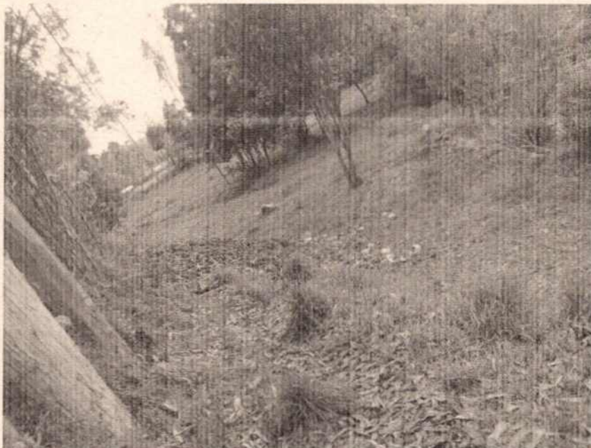
Imagen 1. Mala disposición de residuos orgánicos

Teniendo en cuenta que en sitio ubicado con coordenadas: E: 918842 N: 590645 se evidenció mala disposición de residuos orgánicos tal como se muestra en la imagen 1, se requiere realizar la recolección y disposición final de estos residuos adecuadamente.