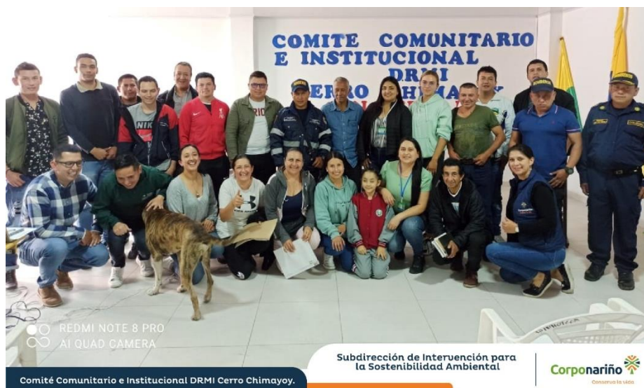
Comité Comunitario e Interinstitucional DRMI Centro Chimayoy – municipio de San Bernardo

El norte de Nariño lidera Comité Comunitario e Institucional con Corponariño para visibilizar retos de conversación en el Área Protegida del Distrito Regional de Manejo Integrado - Cerro Chimayoy